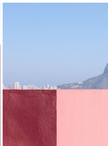
Senza Titolo #12, Dialogues 2019, 1/9 Edition 55 x 70cm