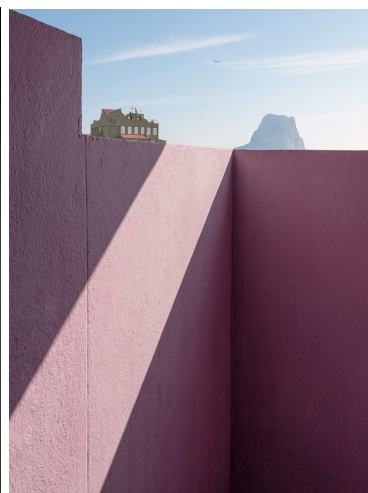
Senza Titolo #8, Dialogues 2019, 1/5 Edition 80x100cm